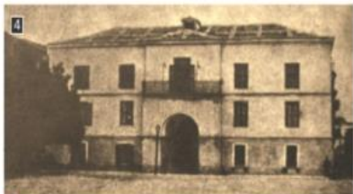
▲ Το Κυβερνείο στο Ναύπλιο, το οποίο έγινε πρωτεύουσα του ελληνικού κράτους το 1828